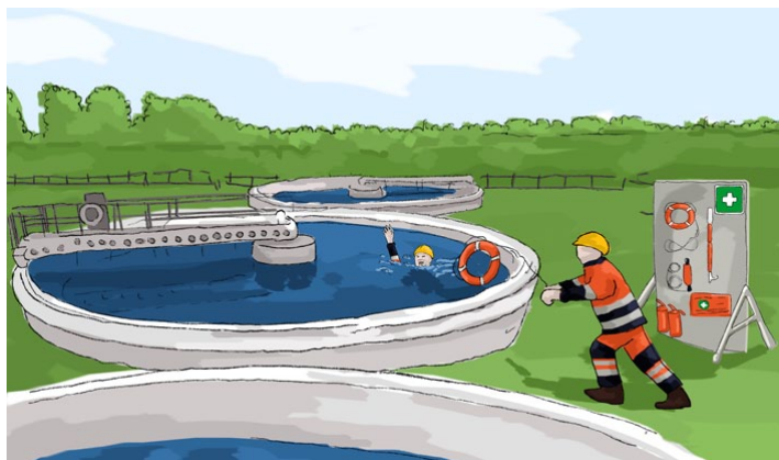
Rys. 1. Organizacja punktów pierwszej pomocy