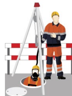
Rys. 4. Asekuracja pracowników przy pomocy trójnogów